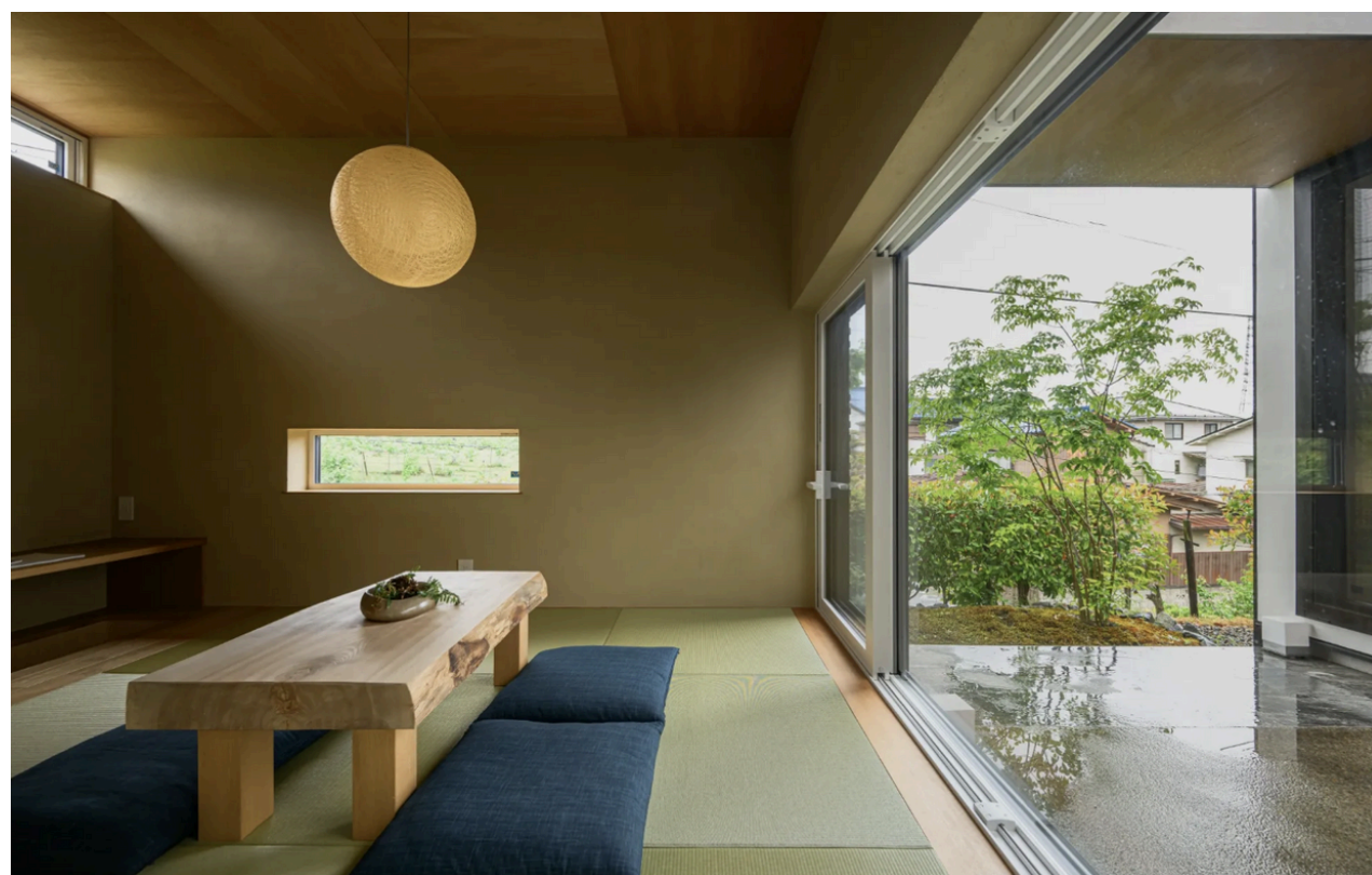
上田市・上田モデルハウス